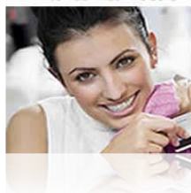
» Finibanco Visa Classic

Agora, todos os dados estão disponíveis para consulta remota através do sincronismo construído entre os PDA's e o servidor central. O cadastro do bem está disponível por tipo de bem, por atributos de cada tipo de bem como por localização, suportados por mapas dos bens inventariados.